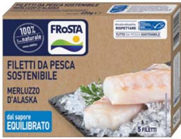
Cod. 622 Cuori di filetto di merluzzo FROSTA - gr. 400