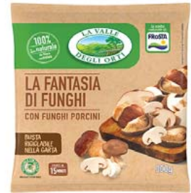
Cod. 597 Fantasia di Funghi gr. 300