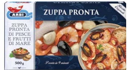
Cod. 839 Zuppa pronta di Pesce e Frutti di mare - gr. 500