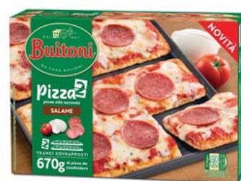
Cod. 592 Buitoni Pizza alla seconda Salame - gr. 670