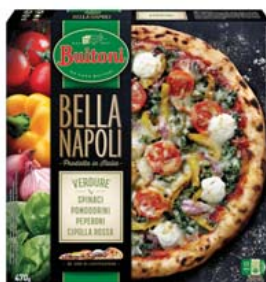
Cod. 629 Buitoni Bella Napoli Verdure - gr. 470