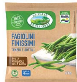
Cod. 617 Fagiolini Extrafini gr. 600