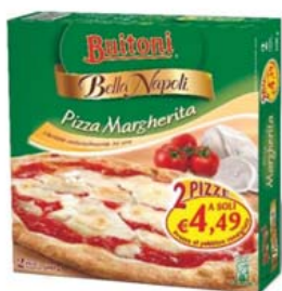
Cod. 641 2 Pizze Margherita Special Buitoni - gr. 600