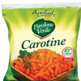
Cod. 792 Carotine Passione verde gr. 450