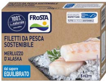
Cod. 622 Cuori di filetto di merluzzo FROSTA - gr. 400