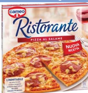
Cod. 965 Pizza al Salame gr. 320