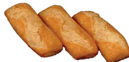
Cod. 8566 Ciabatta di grano tenero S. Francesco - gr. 110