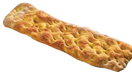
Cod. 8285 Focaccia Srokia curcuma e zenzero - gr. 300