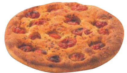
Cod. 8327 Focaccia Pugliese Pomodorini