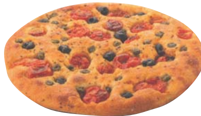
Cod. 8328 Focaccia Pugliese Pomodorini/olive