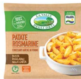
Cod. 595 Patate Rosmarine gr. 450