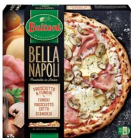
Cod. 580 Buitoni Bella Napoli Prosciutto e funghi - gr. 415