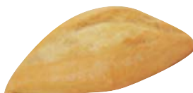
Cod. 767 Panino rustico mediterraneo Spagna - gr. 50