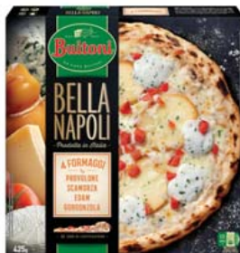
Cod. 636 Buitoni Bella Napoli 4 formaggi - gr. 425