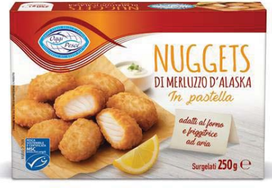
Cod. 8632 Nuggets di merluzzo OGGI PESCE - gr. 250