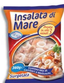
Cod. 8622 Insalata di mare cotta Oggi pesce - gr. 360