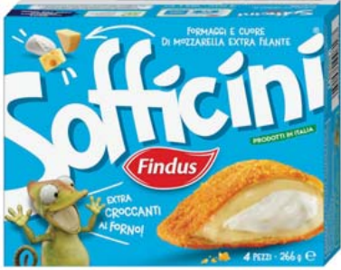
Cod. 926 Sofficini ai Formaggi gr. 266