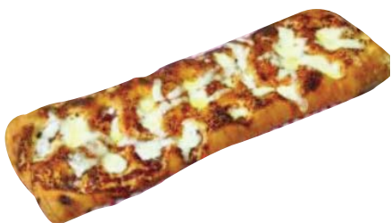
Cod. 8493 Pizza pala margherita gr. 300