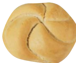
Cod. 8448 Kaiser Viennese