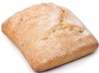
Cod. 8097 Chapata gourmet - gr. 90