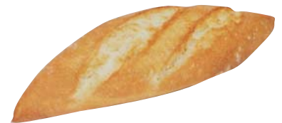
Cod. 8098 Bocata gourmet - gr. 90