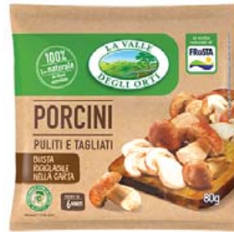
Cod. 601 Porcini gr. 80