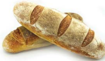
Cod. 8435 Palatella Napoletana gr. 500 - 1 x 20