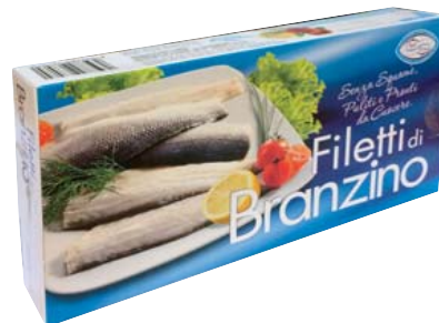
Cod. 8595 Filetti di Branzino gr. 250