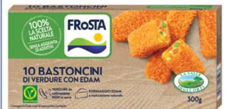
Cod. 584 Bastoncini di verdura e edam Frosta gr. 300 - 1 x 10