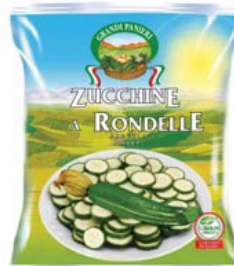
Cod. 8639 Zucchine a rondelle Grandi Panieri - kg. 1