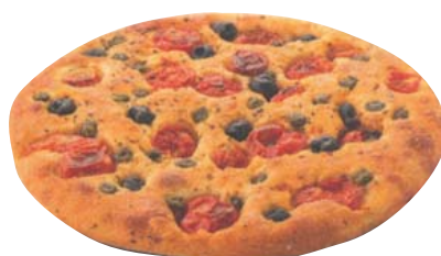
Cod. 8328 Focaccia Pugliese Pomodorini/olive