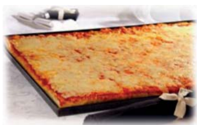
Cod. 8326 Pizza Margherita gr. 850