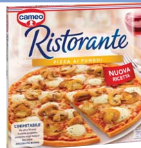
Cod. 987 Pizza Funghi gr. 365