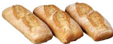
Cod. 8565 Ciabatta alla patata S. Francesco - gr. 240