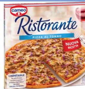
Cod. 984 Pizza al Tonno gr. 355