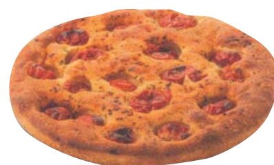
Cod. 8327 Focaccia Pugliese Pomodorini