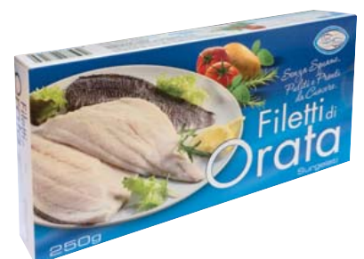
Cod. 8596 Filetti di Orata gr. 250