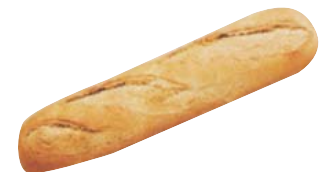
Cod. 8436 Mezza Baguette S. Francesco - gr. 140