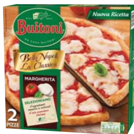
Cod. 696 Bella Napoli - Margherita gr. 650