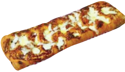
Cod. 8493 Pizza pala margherita gr. 300