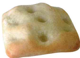
Cod. 8003 Focaccina Soft gr. 40 - Italia - 240° per 4 min.