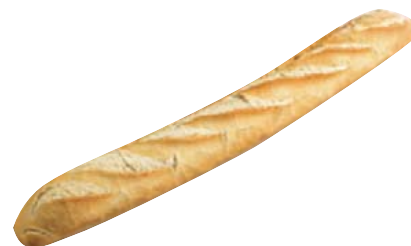
Cod. 8433 Baguette P.P. gr 280 S. Francesco - 200° per 15 min.