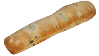
Cod. 8325 Bastoncino con olive gr. 100/120