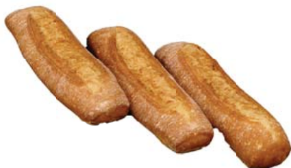
Cod. 8564 Ciabatta 100% Semola S. Francesco - gr. 300