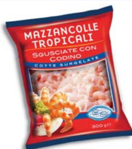
Cod. 814 Mazzancolle Tropicali Sgusciate - gr. 300