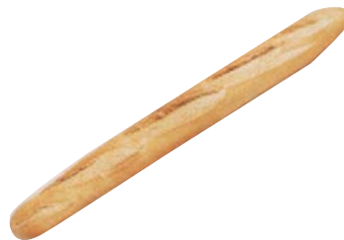
Cod. 759 Baguette Precotta Francia gr. 280