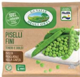
Cod. 598 Piselli Fini gr. 450