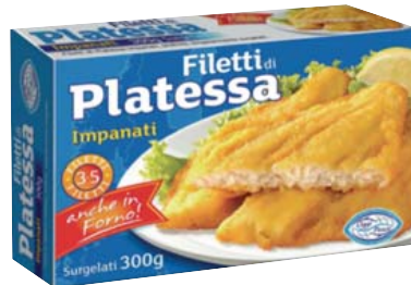
Cod. 731 Filetti di Platessa Panata gr. 300