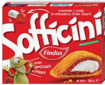
Cod. 927 Sofficini Pomodoro e Mozzarella - gr. 266