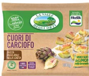
Cod. 596 Cuori di Carciofi gr. 300