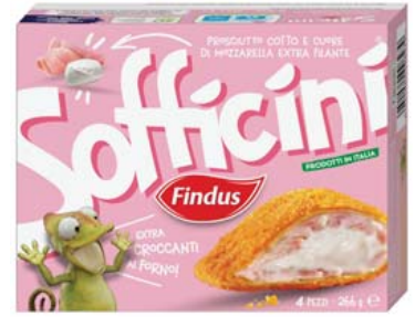
Cod. 929 Sofficini Prosciutto Cotto gr. 266