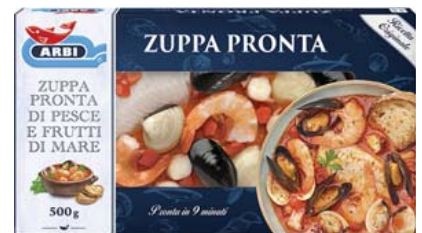
Cod. 839 Zuppa pronta di Pesce e Frutti di mare - gr. 500