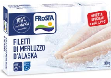
Cod. 634 Filetto di Merluzzo FROSTA - gr. 300