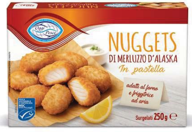
Cod. 8632 Nuggets di merluzzo OGGI PESCE - gr. 250