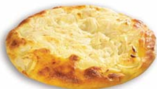
Cod. 8494 Focaccia monoporzione cipolle