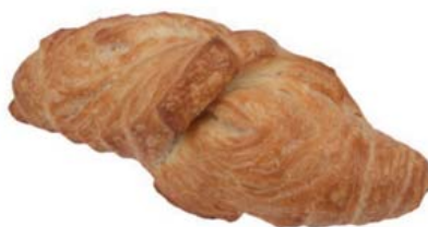
Cod. 891 Schiocco classico