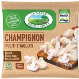
Cod. 657 Gli Champignon gr. 600