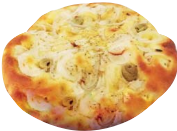
Cod. 8339 Focaccia Pugliese Cipolle