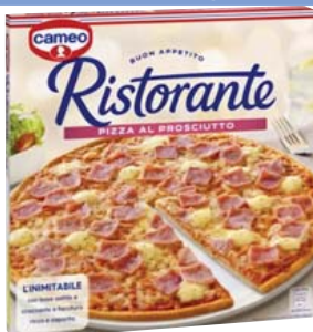
Cod. 988 Pizza Al prosciutto gr. 335