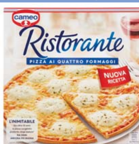
Cod. 985 Pizza Quattro Formaggi gr. 340