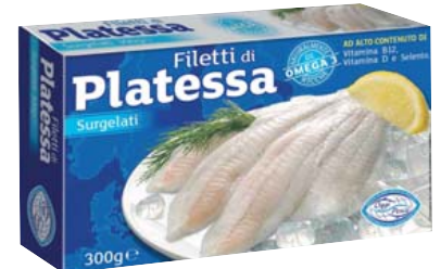
Cod. 729 Filetti di Platessa gr. 300