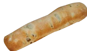
Cod. 8325 Bastoncino con olive gr. 100/120