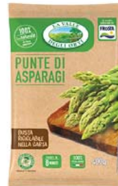
Cod. 604 Punte di Asparagi gr. 400