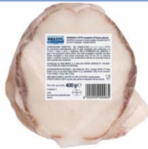
Cod. 833 Verdesca - gr. 400