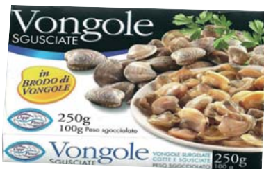
Cod. 798 Vongole Sgusciate gr. 250