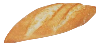
Cod. 8098 Bocata gourmet - gr. 90