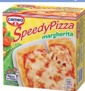
Cod. 986 Speedy Pizza Cameo - gr. 225