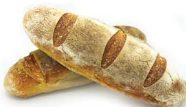
Cod. 8435 Palatella Napoletana gr. 500 - 1 x 20