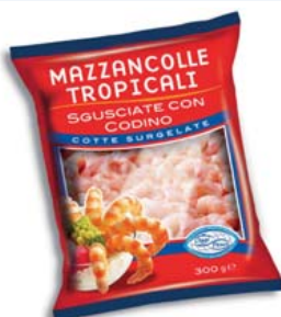
Cod. 814 Mazzancolle Tropicali Sgusciate - gr. 300