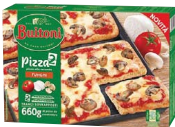
Cod. 8302 Buitoni Pizza alla seconda Funghi - gr. 660