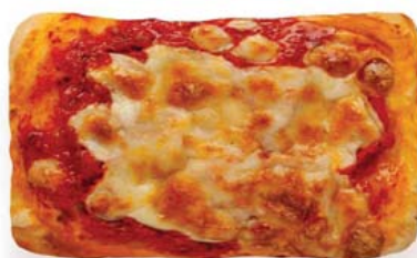
Cod. 8324 Pizza margherita monoporzione