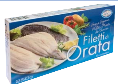
Cod. 8596 Filetti di Orata gr. 250