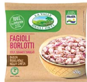
Cod. 660 Fagioli Borlotti gr. 450