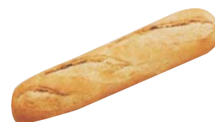
Cod. 8436 Mezza Baguette S. Francesco - gr. 140