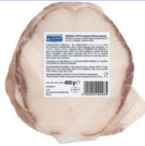
Cod. 833 Verdesca - gr. 400