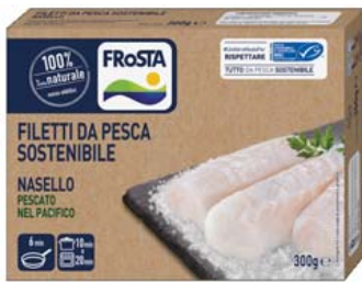
Cod. 623 Cuori di filetto di nasello FROSTA - gr. 300