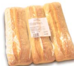
Cod. 851 Cia-bar Pane precotto Italia