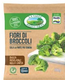
Cod. 661 Fiori di Broccoli gr. 300