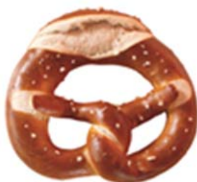
Cod. 8470 Pane Brezel