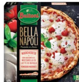
Cod. 640 Buitoni Bella Napoli Margherita - gr. 425