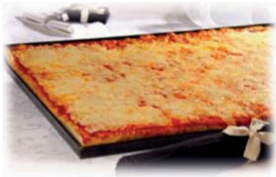
Cod. 8326 Pizza Margherita gr. 850