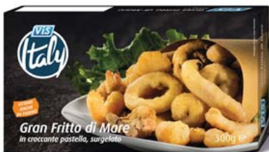
Cod. 928 Gran Fritto di Pesce gr. 300