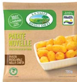
Cod. 616 Patatine Novelle gr. 750